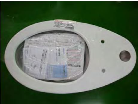
ボール中に納める