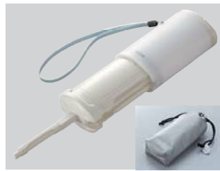
YEW350 携帯ウォシュレット (乾電池付き) 希望小売価格 ¥13,100