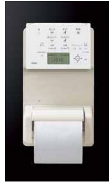
※紙巻器は別売りです。