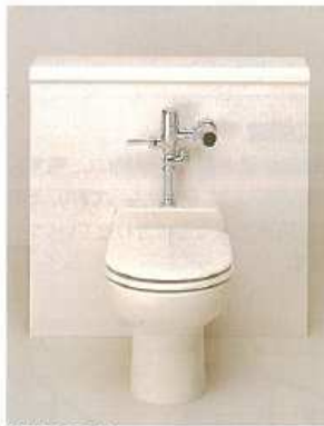
UTKC11 大便器ライニングコンボ