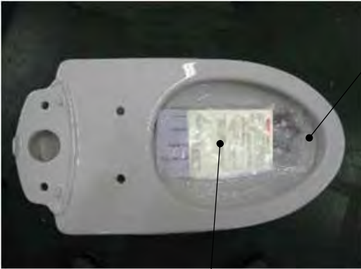
QRラベル貼付説明書 (BHMのみ)