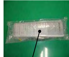
レバーハンドル部、施工説明書 手洗金具