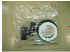
固定具類ユニット