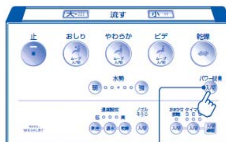
パワー脱臭入/切スイッチ