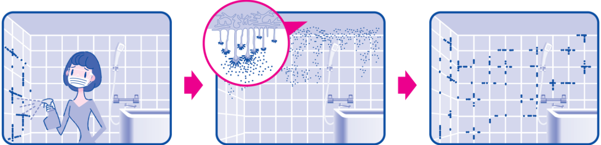
一生懸命、カビ取りをしても…

A 黒カビの原因は、目に見えない原因菌。天井や換気扇の裏に潜む原因菌が、カビ胞子を浴室全体にバラまくから、目に見えるカビを落とすだけでは、またすぐに生えてしまうのです。